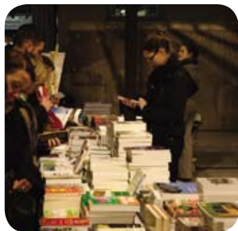
En 2008, la librairie du Festival était tenue par la Librairie des Orgues .