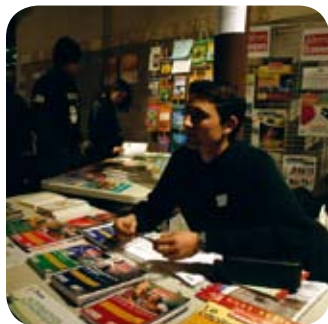
Le stand d' Alternatives économiques en 2008.