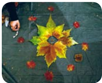
L'atelier Land Art sur le Festival Jeune Public 2008.

Un véritable Festival dans le Festival !